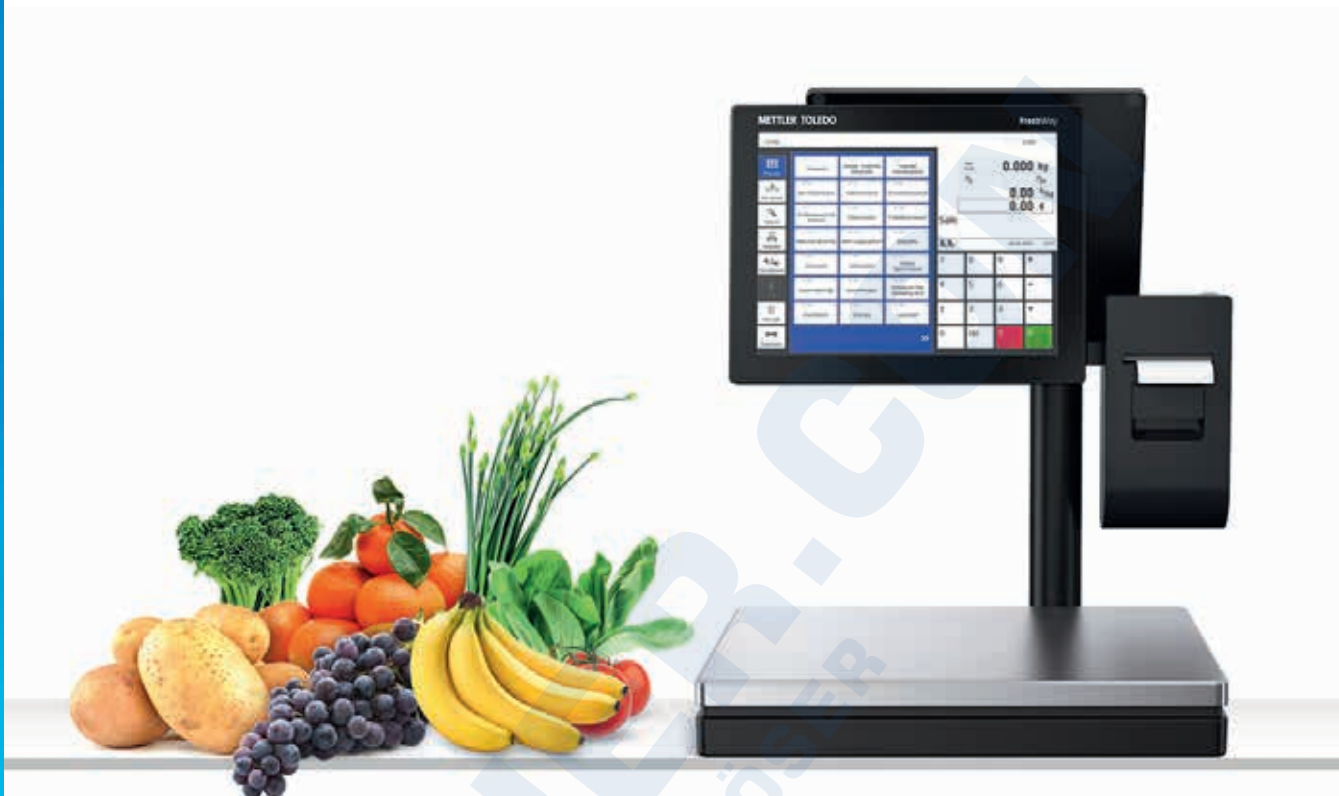
FreshWay Tower PC Scale

FreshWay Tower ist die neue METTLER TOLEDO Touchscreen-Waage für anspruchsvolle Unternehmen des Lebensmitteleinzelhandels. FreshWay T vereint prämiertes Design mit perfekter Performance – für ein Höchstmaß an Wäge- und Bedienkomfort.